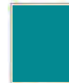
STRANA 205x275 mm čistý formát 175x248 mm na zrcadlo

V hodnotě 119.000 Kč Cena pro Vás: sleva na poptávku