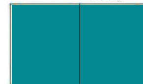
DVOUSTRANA 410x275 mm čistý formát

V hodnotě 189.000 Kč Cena pro Vás: sleva na poptávku