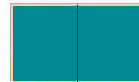
DVOUSTRANA 410x275 mm čistý formát

V hodnotě 139.000 Kč Cena pro Vás: sleva na poptávku